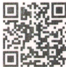
中国机械工业出版社